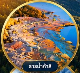
ธารน้ำห่าสี