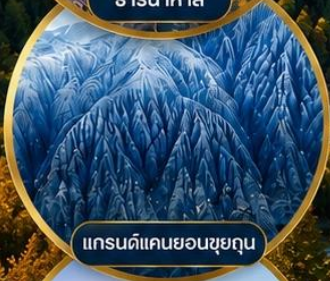
แกรนด์แคนยอนซูยถุน